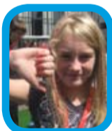
Ik ga omlaag